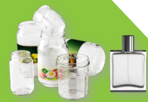
Pots, bocaux, flacons