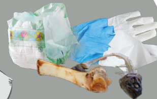
Couches, gants, lingettes, os, arêtes, ...