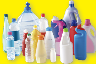
Emballages en plastique