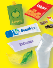
Autres emballages en plastique