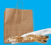
Sachets et sacs en papier vides