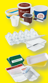
Barquettes et pots