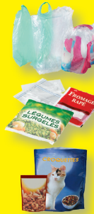
Films et sacs